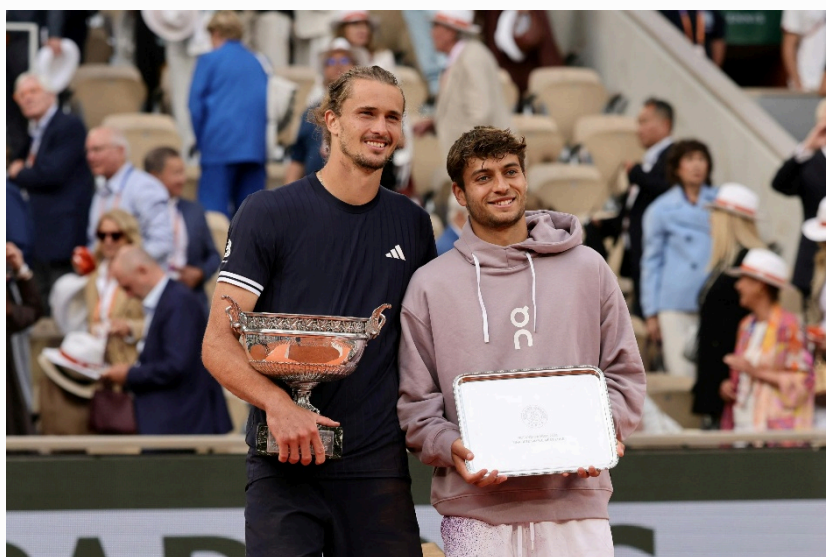
Zverev (à gauche) et Cobolli (à droite) après la finale.

Flavio Cobolli n'a jamais lâché, faisant basculer à plusieurs reprises le destin de la finale, offrant à ce match un scénario extraordinaire.